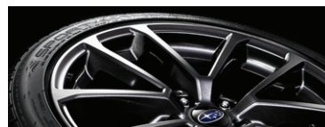
18" легкосплавные диски